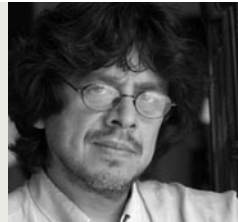
FERNANDO IWASAKI (Lima, 1961)

Maiatza 14 Mayo • Asteazkena / Miércoles • 19:00